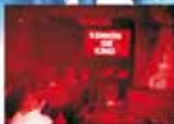
JEDEN DIENSTAG INCREDIBLY STRANGE FILM CLUB TWEN ABEND BARCEL WERBUNG