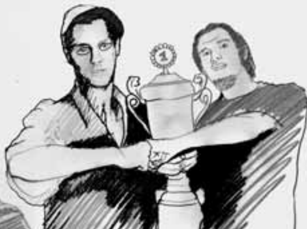
rainbow warrior HEAVYWEIGHT CHAMPION SOUND

Seit über 6 Jahren ein für mich regelmäßiges Szenario: Wochenende für Wochenende auflegen, hinter den Reglern stehen und für die Abendunterhaltung der Gäste verantwortlich sein. Aber wie sieht es davor aus? Wenn es in andere Läden geht, dann ist das eher ein Betriebsausflug, in dem Stil: Hören was geht, Anregungen holen. Doch was passiert am eigenen Abend? Gast auf der eigenen Party sein. Das wäre doch mal was! Aber wie? Klonen ist nicht! Vertreten lassen? Läuft dann der selbe Sound? Wie etwas erleben, was man sonst selber macht? Und dann kommt die Möglichkeit: Als Mitglied eines DJ-Teams sich mal selber auswechseln, raus auf die Ersatzbank, einen Gast-DJ einwechseln, der Rest der Mannschaft bleibt am Ball. Und dann ist es soweit: Gast auf der eigenen Party. Mit Freunden unterwegs, die sonst meine Gäste sind. Seit Jahren mal wieder getanzt. Spaß gehabt und trotzdem kritisch zugehört. Später darf man sich dann auch die Frage gefallen lassen, ob man Speed in die Zahnpasta gemischt bekommen hat. Bin froh, diese Gelegenheit mitgenommen zu haben. Mal sehen, ob es wieder 6 Jahre dauert.