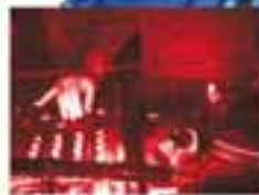
JEDEN SONNTAG DIE ELEKTRONISCHE KASSELBRAND MIT HELGOLDEN AUS DEM PARALLAXRAUM